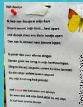
Gedicht Het doosje