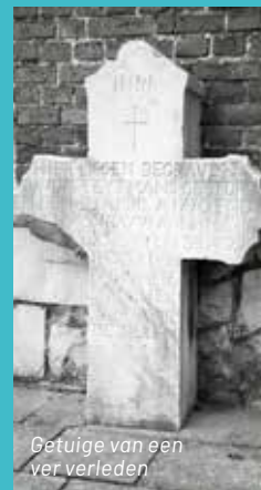
Getuige van een verleden

Onze oudste grafsteen bij de kerk, een zorg voor het overleden verleden