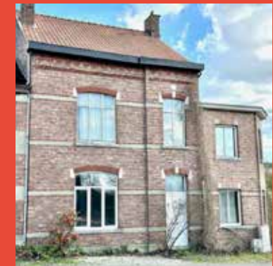
Een handelspand in Sint-Lambrechts-Herk verdween om plaats te maken voor een nieuw bouwproject. Het oude gebouw verborg het verhaal van meerdere generaties.