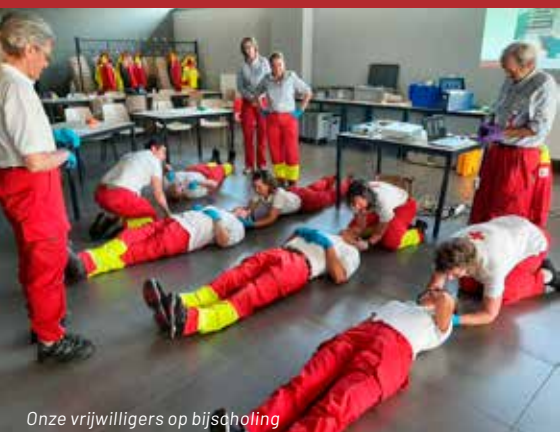
Onze vrijwilligers op bijscholing

Wie zin heeft om deel uit te maken van ons enthousiaste team, mailt best naar info@sint-lambrechts-herk-stevoort.rodekruis.be .