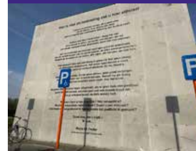
Muur achtergevel CCHasselt