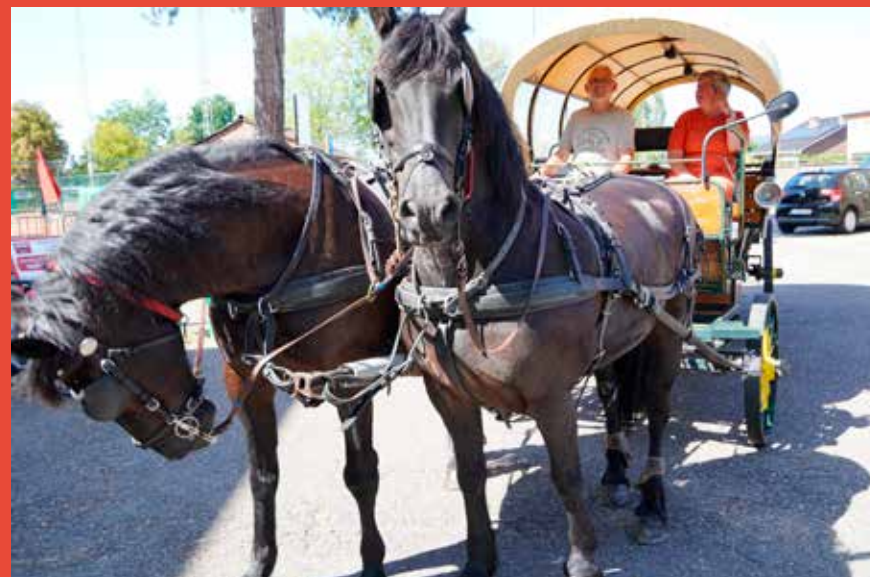
Tijdens de dorpsfeesten van Volle Bak Herk 2022 konden we ze uitgebreid fotograferen. Mooi toch?