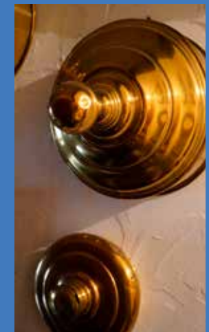
De koperen ijsjesdeksels van Pol