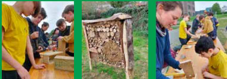
20 vogelhuisjes bouwen, en enkele bijenhotelletjes, da's zo gebeurd!