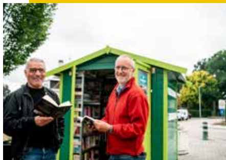
Heb je een tof idee voor je buurt? Vraag er dan wijkbudget voor aan.