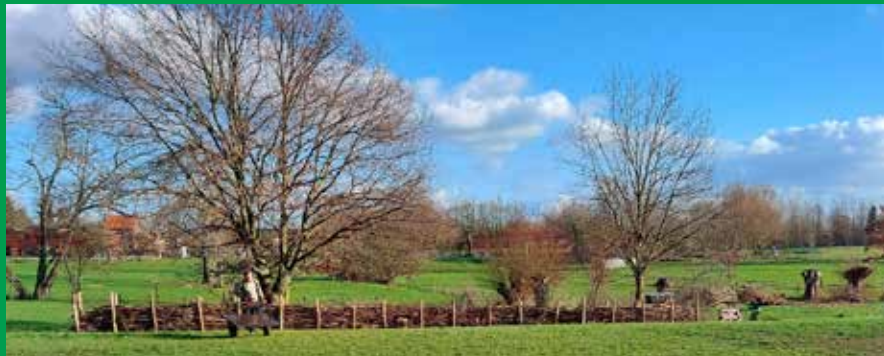
In de takkenwal kunnen voortaan vogels nestelen zoals de winterkoning en heggemus. Het biedt uitstekende schuilgelegenheid aan insecten en kleine zoogdieren, zoals (spits)muizen, egel en wezel en aan amfibieën, zoals de pad.