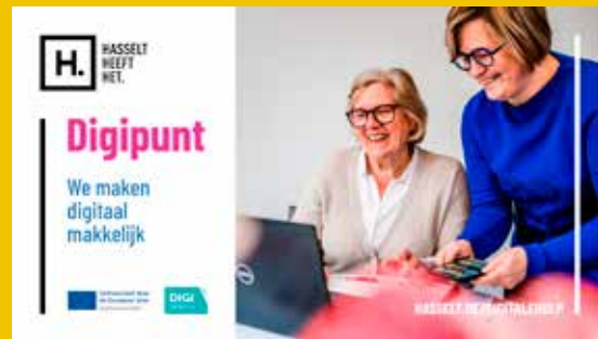
In het Digipunt in je buurt maken we digitaal makkelijk.