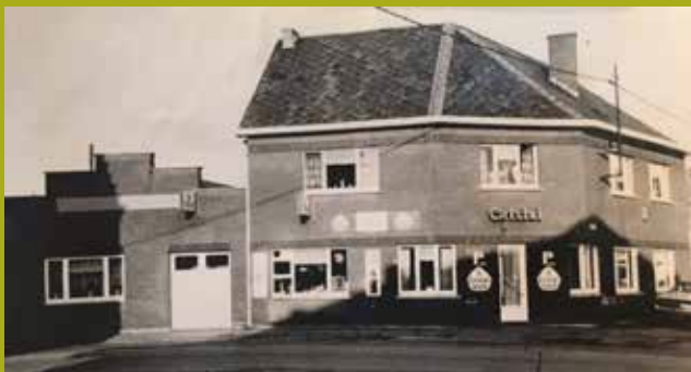
Café, frituur, ijssalon én feestzaal op de hoek van de Sint-Truidersteenweg en de Vorststraat.