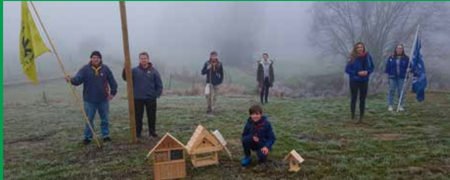
Vroeg uit de veren: door de voltallige ploeg werden 25 bomen en een haag aangeplant.

Onze jeugdverenigingen Chiro en KSA zijn echte natuurliefhebbers. Ze tonen dit in hun diverse acties waarin ze de jongeren actief betrekken in natuurbeheer en natuurbeleving. Jong geleerd is oud gedaan!