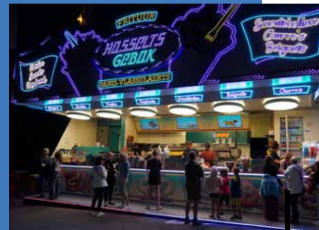
Wat is er bij Herk kermis lekkerder dan een smoutebol?

Donderdag 15 augustus 2024 van 16u00 tot 23u00