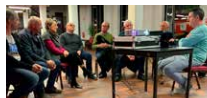
Open vergadering voor alle geïnteresseerde Herkenaren op 17 april