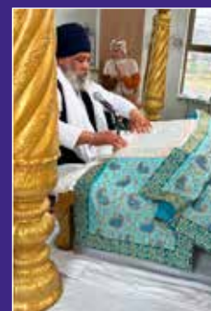
Voor een Sikh is muziek de taal van de ziel. Je vindt ze op internet onder: 'punjabi music' of 'sikh music'.