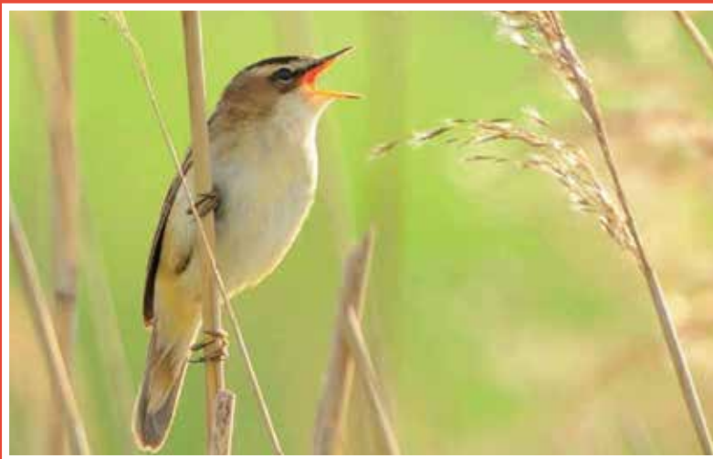
Goesting voor een uitbundig ochtendconcert

Uitleiding: Geld maakt me niet gelukkig, maar ik kan er wel koeien mee kopen, en koeien geven melk, en van melk kan je ijsjes maken, en ijsjes ... die maken me érg gelukkig!