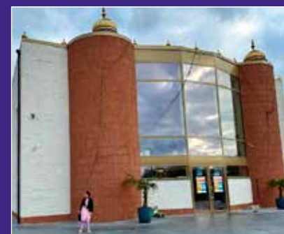
De Sikhi gemeenschap is de vijfde grootste wereldgodsdienst

Bij een bezoek aan een Gurudwara wast een Sikh handen en voeten. Voor het heilige boek buigt hij, biedt offerandes aan en raakt met het voorhoofd de grond. Voor bezoekers volstaat een buiging. (Er is eveneens een Singh Sabha Gurudwara in het nabije Alken, Steenweg 418)